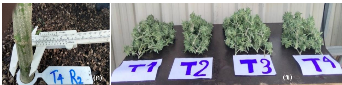
ภาพที่ 3 การบันทึกข้อมูล (ก) วัดเส้นผ่านศูนย์กลางลำต้นและ (ข) เปรียบเทียบน้ำหนักช่อดอกสด