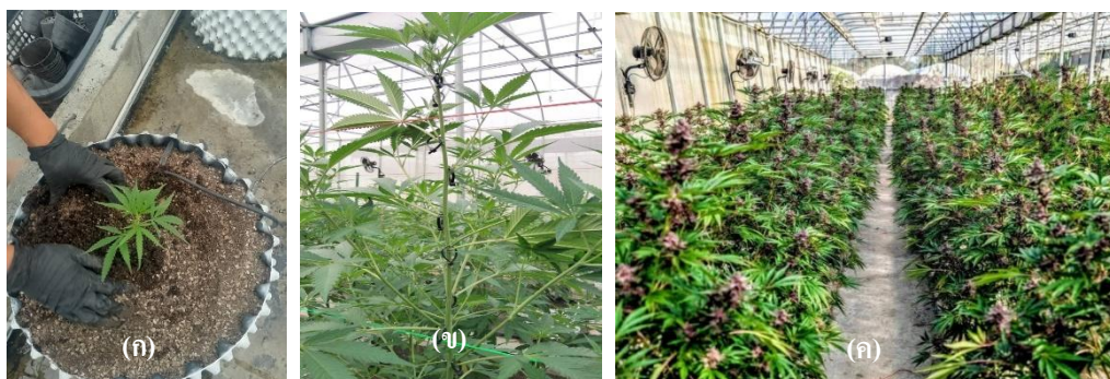
ภาพที่ 2 การทดลองวัสดุปลูกสูตรที่แตกต่างกันต่อการเติบโตของกัญชาในโรงเรือน (ก) นำวัสดุปลูกบรรจุลงในกระถาง (ข) และ (ค) นำกัญชาปลูกในโรงเรือน ให้แสงสว่างทุกวันจนถึงระยะออกดอก